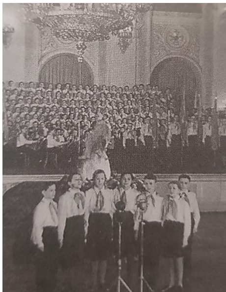
Выступление хора Ансамбля пионерской песни и пляски в Кремле. 1954 г.