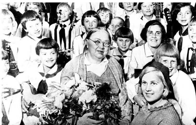
Н.К. Крупская с пионерами

Значительную роль в довоенной истории Дома пионеров сыграла Крупская. Занимавшая в те годы пост заместителя наркома по народному просвещению. Она несколько раз бывала в Доме пионеров. Основные претензии у нее были к тому, что не должны заниматься только успевающие и только одаренные дети, нужно работать с массой школьников, отрывать их от влияния улиц. А также отсутствие общественной работы у кружковцев. Посетив шахматный кружок, она упрекала. Что в нем совсем мало девочек. По ее мнению они должны были освоить во Дворце навыки по шитью и рисованию, организовывать кружки в клубах при домах, детских комнатах и в красных уголках, внушать детям с улиц позитивный образ советского строя.