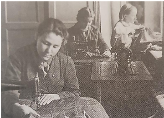
Девочки шьют в швейной мастерской телогрейки для фронтовиков. 1942 г.

В январе 1942 года Гордом взял шефство над одним из военных госпиталей. Столярный кружок делал для раненых мундштуки, швейный — кисеты, воротнички и носовые платки. К праздникам пионеры собирали для бойцов книги и грампластинки, подарили им патефон и аллоскоп.