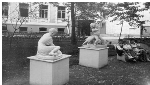
Скульптуры в саду Дома пионеров