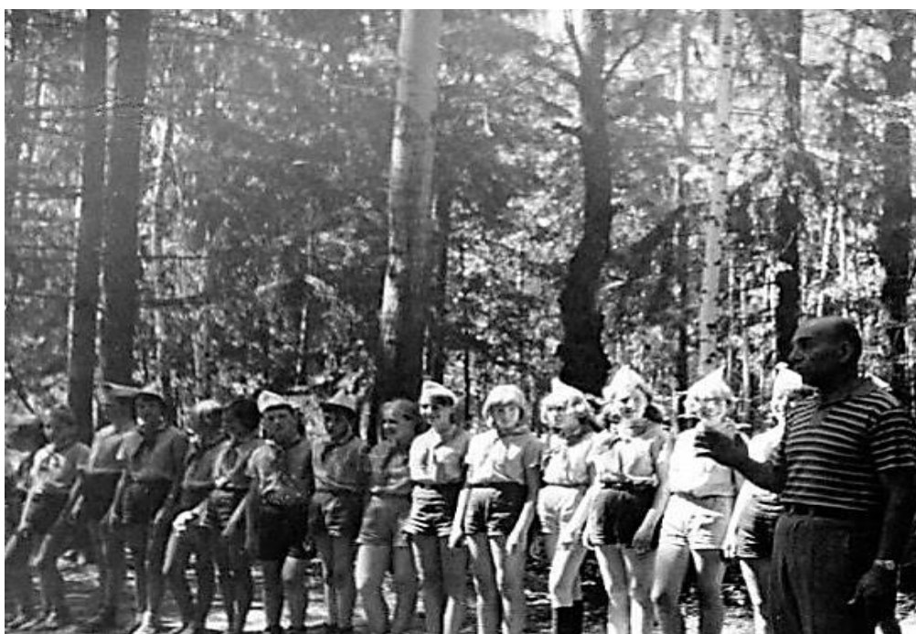
«Дети Капитана Гранта» верны своему учителю. Туристическая поездка с пионерами.

За многие годы через многодневные походы и туристские лагеря капитана Гранта прошли несколько тысяч человек. Не все их выпускники стали мастерами спорта по туризму, но все выросли людьми, достойными памяти своего Учителя.