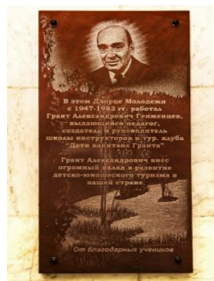
Памятная доска от благодарных учеников