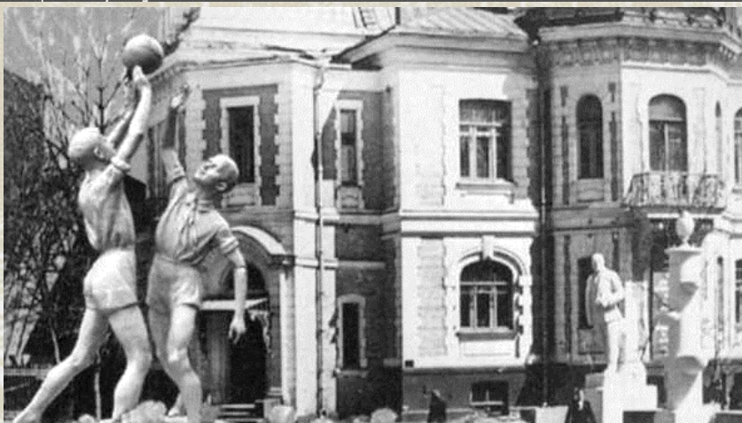
скульптуры в саду Дома пионеров

На территории парка был сад с плодовыми деревьями, небольшой зоопарк, бассейн, в котором жили рыбки. Здесь были обустроены зоны отдыха с уютными скамейками, но главным местом парка был Зеленый театр с амфитеатром на 800 мест.