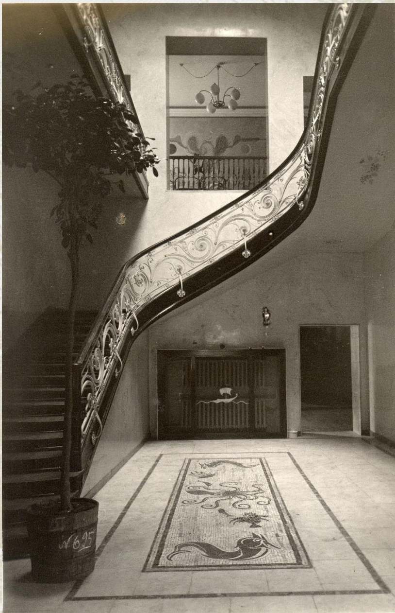
Мозаика на полу и сама лестница за 80 лет прекрасно сохранились, не правда ли?