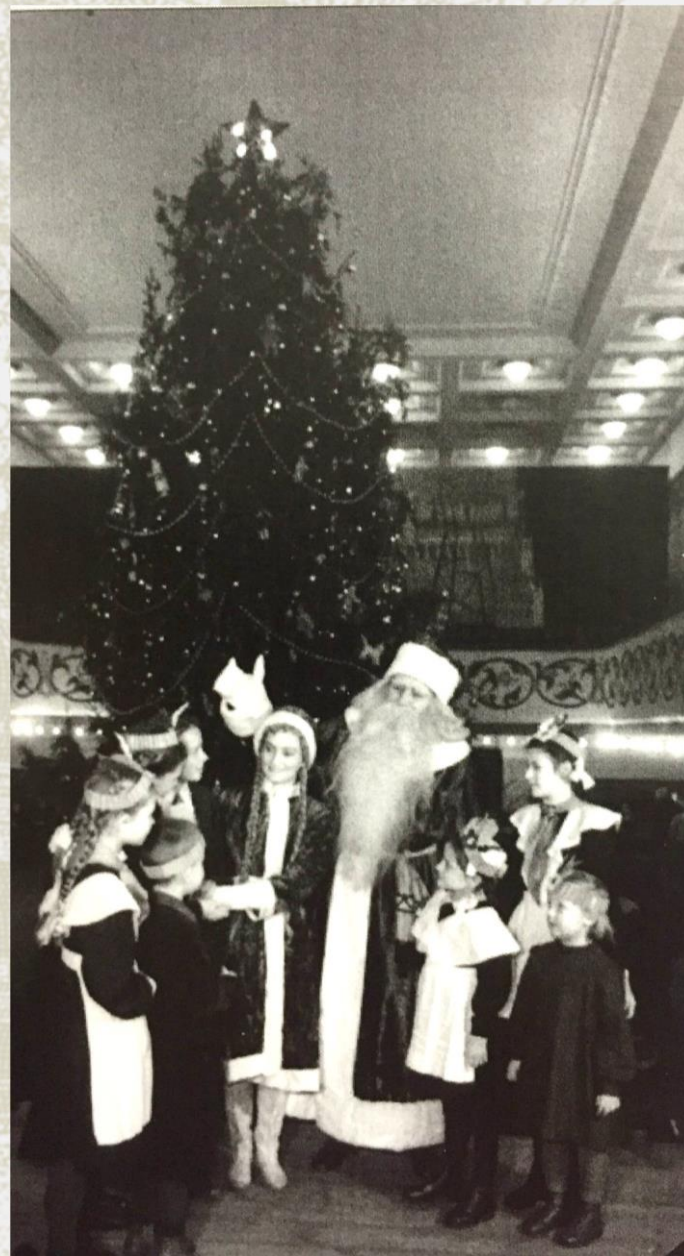
А вот роспись балкона в зале, к сожалению, до наших дней не дожидка.