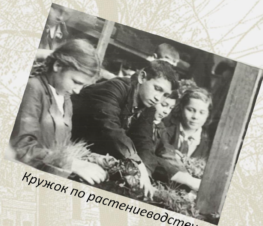
Кружок по растениеводству