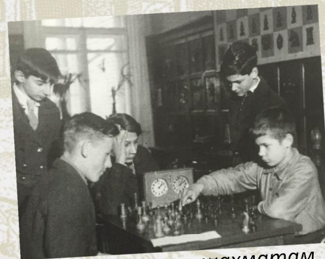
Кружок по шахматам