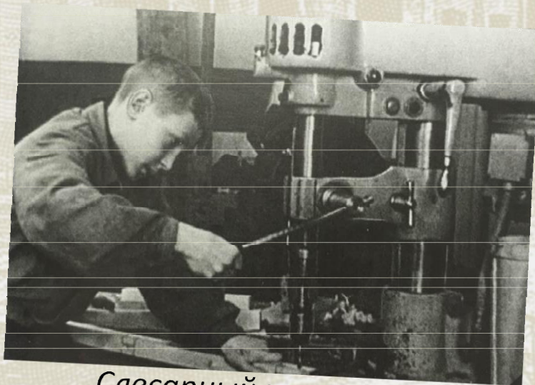
Слесарный кружок. Во время войны работал для фронта.