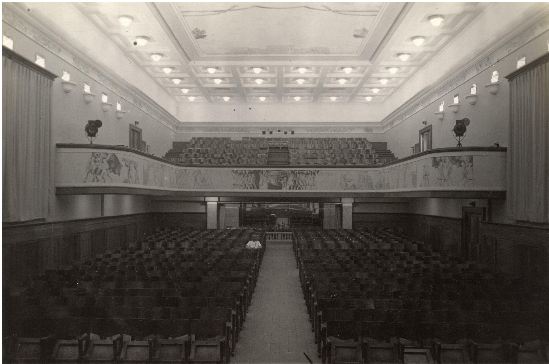
Наш прекрасный большой зал. Рабоче-крестьянские росписи балкона и потолка не сохранились. Здесь не было «каморочной» радио-рубки (управление светом и звуком велось непосредственно в зале). Виртуального объема залу добавляли зеркала, находившиеся на задней стене.